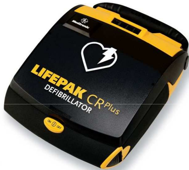
Abbildung eines AED-Gerätes