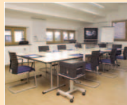
Langbürgner See (36 m²)