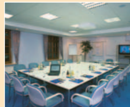
Chiemsee (72 m²)