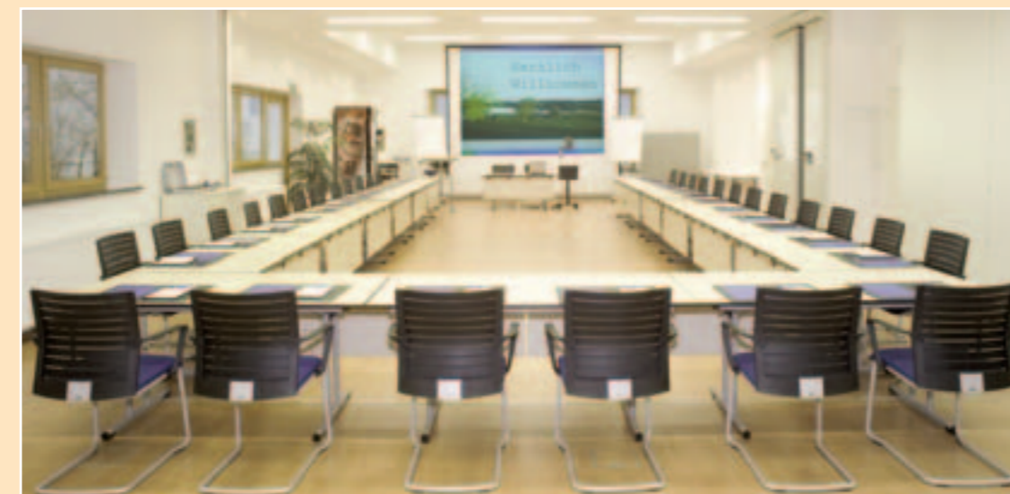
Franz-Xaver-Völkl-Raum (144 m²)