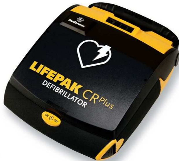
Abbildung eines AED-Gerätes