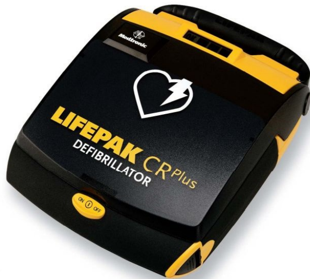
Abbildung eines AED-Gerätes